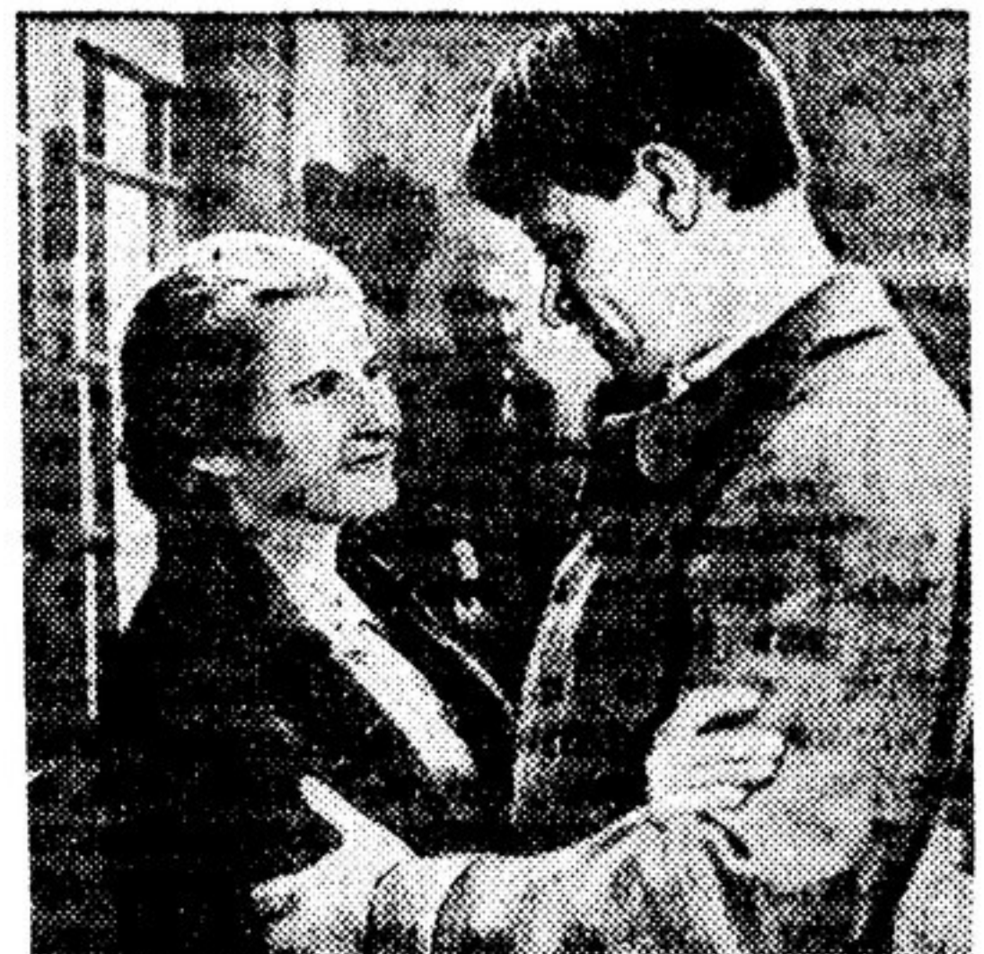
Кадр из фильма «Анна пролетарка»

Отложить партийный съезд и, проделав «левым» маневром, одновременно уйти из правительства, обмануть этим маневром пролетариат, передать власть в молодой