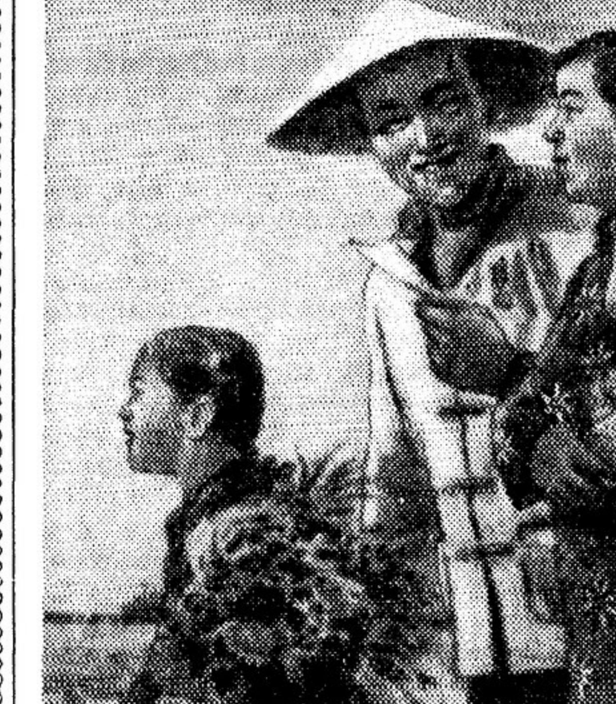
В различных районах Китайской Народной Республики происходят выборы в собрания народных представителей.

...Радио громко разносило по всей строительной площадке народные песни. Труд и песни сливались и наполняли сердце голостью за человека. Как он величествен и красив, когда свободен!